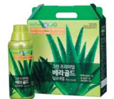
그린알로에는 건강기능식품뿐 아니라 화장품까지 사업 영역을 확장해나가고 있다.

그린알로에의 또다른 자랑거리는 '3무(無) 제품'이라는 것. 전 제품군을 통틀어 합성보존료, 합성착료, 합성착향료가 첨가되지 않았다. 그린알로에의 주력 상품인 액상 타입의 알로에 베라겔 즙액 '그린프리미