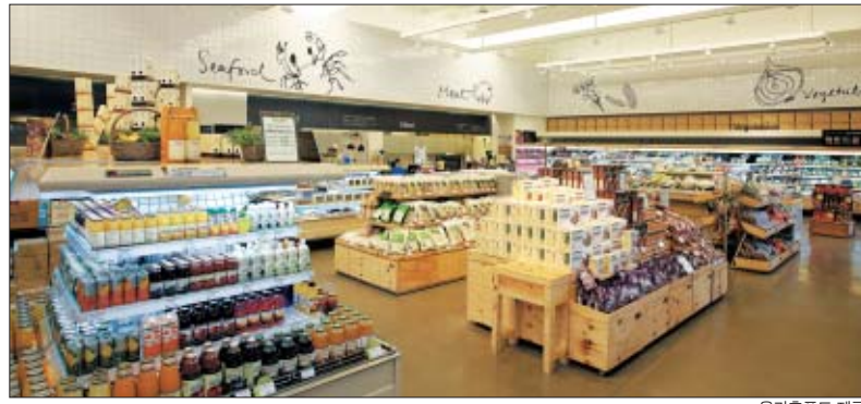
올가는 유전자 변형식품을 사용하지 않는다는 원칙 아래 친환경 식품을 제공한다.

올가는 유기농·무농약 등 친환경 농법으로 재배한 채소, 과일, 양곡에서부터 동물복지기준을 지켜 안전하게 키운 한우, L-글루타민산나트륨·합성 착색료·합성 보존료를 쓰지 않는 '3무(無)'