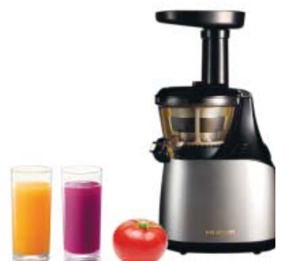
휴롬 원액기는 과일과 채소 속 영양소 파괴를 최소화하면서 원액을 짜내는 저속착즙방식으로 신선하고 건강한 원액을 짜낸다.

또 세련된 제품 디자인으로 세계 3대 디자인상 중 하나인 '레드닷 디자인어워드'로 받았다. 박정현 조선비즈 기자