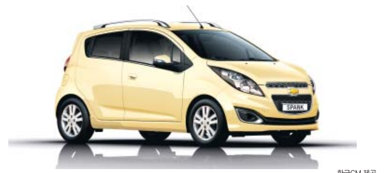
웨보레 스파크는 감각적인 디자인과 뛰어난 주행성능이 강점으로 꼽힌다.

스파크는 경차 최초로 신차안전도평가(KNCAP)에서 1등급 안전성을 공인 받았고, 보험개발원, 유로NCAP 등 국