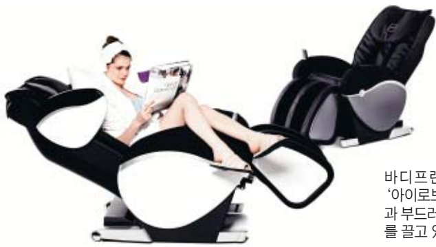
바디프랜드의 안마의자 '아이로보'는 마사지 기능과 부드러운 촉감으로 인기를 끌고 있다.

바디프랜드는 안마의자의 경우 마사지 기능만큼 디자인도 중요하다는 철학을 갖고 자체 디자인 및 특허기술로 만든 2013년 신제품 '아이로보(i-ROVO)'를 출시했다. 아이로보 전체 디자인은 곡선으로 구성되어 있으며 흰색, 은색, 블랙 등 세 가지 색깔을 조화시켜 고급스러운 느낌을 살렸다. 잦은 사용으로 안마 의자