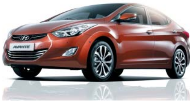
현대자동차 아반떼는 지난 20년 동안 진화를 거듭하며 '국민차' 반열에 올랐다.

아반떼는 또 북미 지역과 남아프리카 공화국, 캐나다 등에서 '올해의 차'로 선정됐다. 전 세계 누적판매량도 800만대를 넘어섰다. 2013년에 판매되고 있는 5세대 아반떼MD는 현대차의 디자인 철학 '유연한 역동성'을 바탕으로 스포티한 이미지가 한층 강조된 것이 특징이다. 아반떼는 지난해 1월 '북미 국제모토