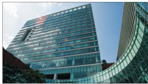
더시티세븐 풀만 엠베서더는 유명 디자이너가 직접 디자인한 10가지 콘셉트의 객실을 갖췄다.

풀만 엠베서더는 투숙객에게 '내 집' 같은 편안한 서비스를 제공하는 것을 원칙으로 한다. 거위털로 만든 침구, 초고속 유선 인터넷과 와이드 평면 TV가 전 객실에 구비돼 있다. 특히 스위트 객실과 이그제큐티브 객실에는 노트북, 내스프레스 커피머신과 전용 라운지 이용 혜택이 주어진다. 국내·외 유명 디자