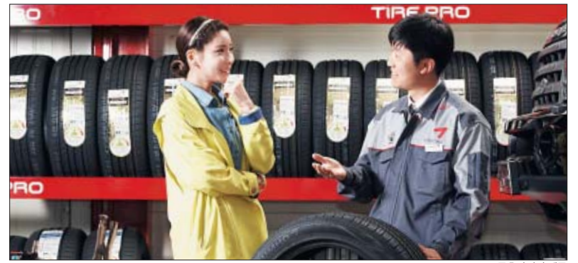
금호타이어는 품질과 서비스를 바탕으로 180여개국에 연간 18억달러의 제품을 판매하고 있다.

타이어 생산은 광주를 중심으로 전남 곡성, 경기 평택과 용인 등 4개 지역의 공장 및 연구소에서 이뤄진다. 해외 생산 및 연구도 병행한다. 미국과 중국의 4개 도시에는 생산 공장이 있으며 독일과 중국, 미국 등 3개 국가에서는 기술